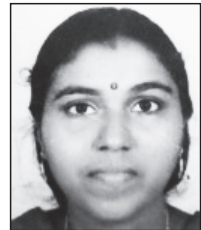
കവിത രചിച്ച പുന്നയ്ക്കാവിള