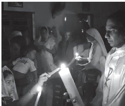
2026 ലെ വിശുദ്ധവാദത്തോടനുബന്ധിച്ച് ഏപ്രിൽ മാസം നടന്ന ഈസ്റ്റർ തിരുകർമ്മങ്ങളിൽ നിന്ന്.