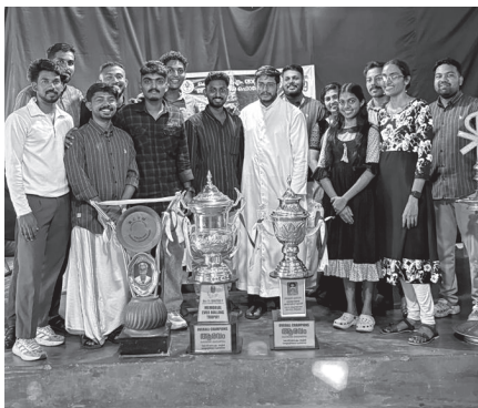
കെ.സി.വൈ.എം. നെയ്യാറ്റിൻകര മെറോന നടത്തിയ ആരംഭം 2K25ൽ തിരുവുറം യൂണിറ്റ് ഓവാൾ ചാമ്പ്യൻസ് ആയപ്പോൾ