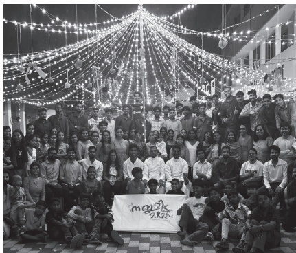
2026 ഏപ്രിൽ 19 മുതൽ 26 വരെ തിരുവുറം വി. ഫ്രാൻസിസ് സേവ്യർ ഇടവകയിൽ വച്ച് നെയ്യാറ്റിൻകര രൂപത മേജർ സെമിനാരിയൻസിന്റെ വെണ്ണ മിനിസ്റ്റിയുമായി ചേർന്ന് നമ്മളിടം എന്ന പരിപാടി സംഘടിപ്പിച്ചപ്പോൾ